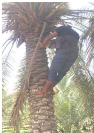
شکل ۲: ابزار سنتی موسوم به پُروند برای بالا رفتن از درخت خرما