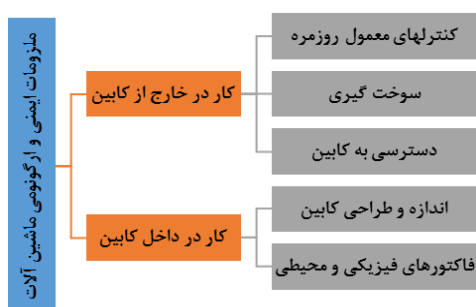
شکل ۱: عوامل انسانی کار با ماشین‌آلات عمرانی

عوامل انسانی کار با ماشین‌آلات معدنی و ترابری را می‌توان در قالب دسترسی، فضای کابین، اهرم‌های کنترل، نمایشگرها، گستره دید و عوامل محیطی مانند سطح ارتعاش و صدا تقسیم‌بندی کرد که در شکل ۱ نشان داده شده‌اند.