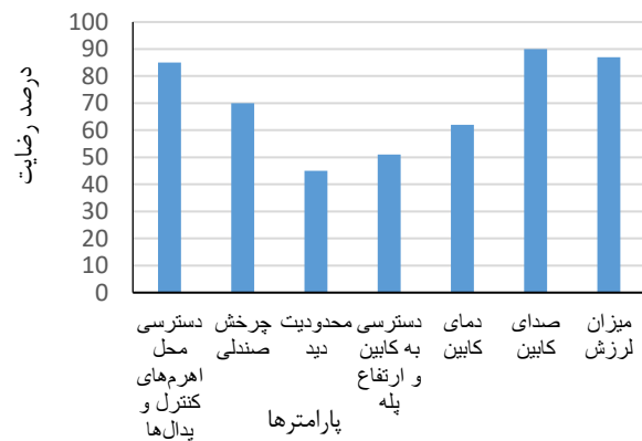
شکل ۴: درصد ناراضی‌های متغیرهای مختلف