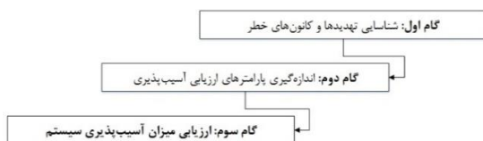
شکل ۱: مراحل اجرای مطالعه

این مطالعه در سه گام اجرا شده است (شکل ۱).