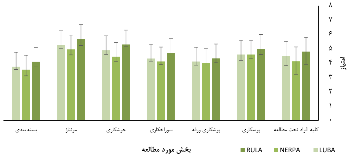
شکل ۲: میانگین و انحراف معیار امتیاز به دست آمده از سه روش LUBA، RULA و NERPA بر حسب بخش‌های مختلف صنعت مورد مطالعه