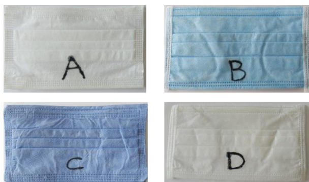
شکل ۱: ماسک‌های پزشکی استفاده شده در این مطالعه

در مطالعه حاضر چهار نوع ماسک پزشکی مورد استفاده توسط کادر درمان، مورد بررسی قرار گرفتند (شکل ۱).