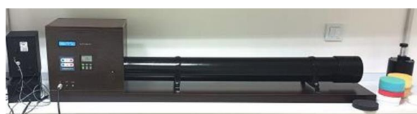
شکل ۲: لوله آمپدانس

و ضخامت ۲۰ میلی‌متر تهیه شدند. در نهایت افت انتقال صدای نمونه‌ها با نرم‌افزار SPSS نسخه ۲۴ با روش اندازه‌های تکراری تعیین شد.