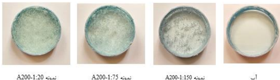
شکل ۱: تصاویر نمونه‌های ساخته شده