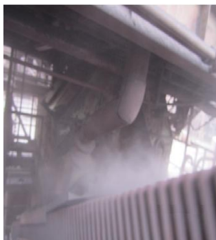
شکل ۲- انتشار غلظت بالای آلاینده در فضای بسته و عدم کارایی هود ۱ شکل ۳- انتشار غلظت بالای آلاینده در فضای باز و عدم کارایی هود ۱۷