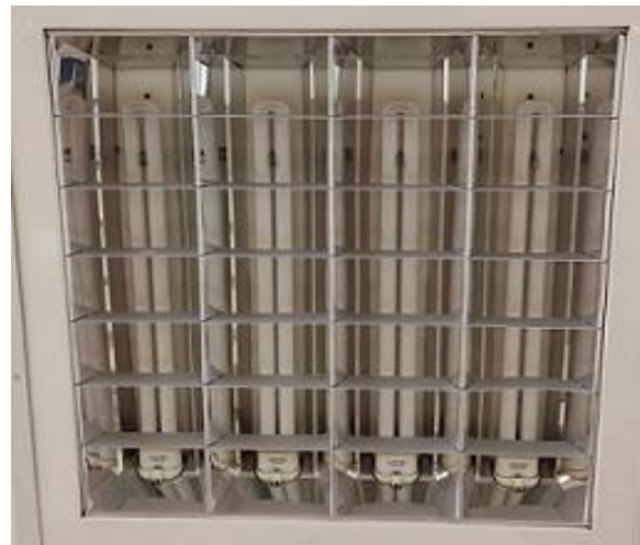
شکل ۱: چراغ‌های استفاده‌شده در محیط کار در حالت خاموش

می‌شود و با استفاده از ICC نمرات حاصل با هم مقایسه می‌شود و به عنوان ضریب پایایی به کار می‌رود. محدوده عملیاتی ICC بین ۱ تا ۰ است. هرچه عدد نهایی به صفر نزدیک‌تر باشد، به معنی این است که پایایی کم است و هرچه به ۱ نزدیک‌تر باشد، به معنی این است که پرسش‌نامه پایایی بهتری دارد.