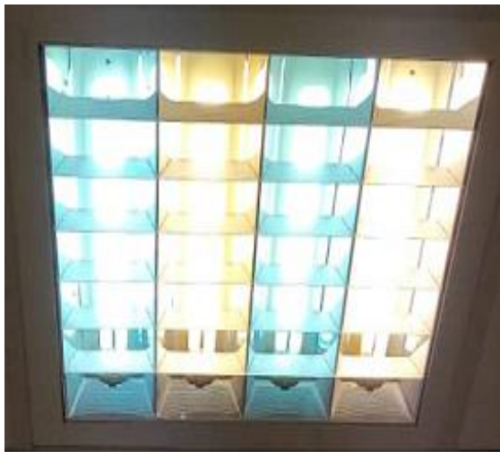
شکل ۲: چراغ‌های استفاده‌شده در محیط کار در حالت روشن