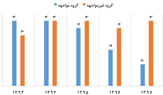
شکل ۲: فراوانی بروز مرگ و میر در دو گروه مورد مطالعه

مطالعه طی پنج سال متوالی با استفاده از آزمون کوکران نشان داد که روند نسبت بروز این مرگ و میرها در گروه پیمانکاران واجد گواهی‌نامه صلاحیت ایمنی معنادار می‌باشد ( P < 0.05 ). این روند در پیمانکاران ساخت و ساز فاقد گواهی‌نامه صلاحیت ایمنی معنادار نبود ( P > 0.05 ). علاوه بر این، مقایسه نقطه‌ای نسبت بروز مرگ و میر دو گروه مواجهه و غیر مواجهه در پنج سال مختلف با استفاده از آزمون Chi-Square نشان داد که این دو گروه طی سال‌های ۹۵-۱۳۹۳ اختلاف معناداری نداشته‌اند ( P > 0.05 )؛ اما اختلاف نسبت بروز مرگ و میر در این دو گروه طی سال‌های ۹۷-۱۳۹۶ معنادار بود ( P < 0.05 ). این یافته‌ها نشان از آن داشتند که میزان بروز مرگ و میر ناشی از حوادث شغلی برای پیمانکاران ساخت و ساز واجد گواهی صلاحیت ایمنی پس از اخذ این گواهی در نیمه دوم سال ۱۳۹۵ کاهش معناداری داشته است ( P < 0.05 ).