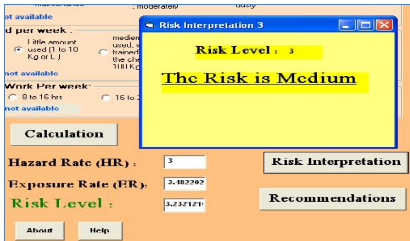
شکل ۶ - تفسیر سطح ریسک محاسبه شده توسط نرم افزار SQCRA