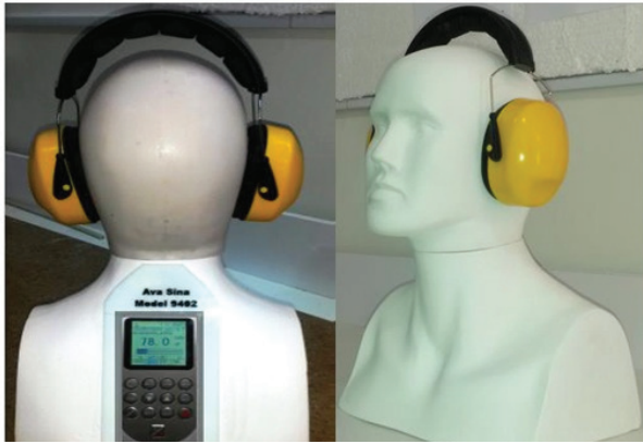
تصویر ۲: تعیین قدرت کاهندگی صدای گوشی با استفاده از مانکن سر مطابق با استاندارد ISO ۳-۴۸۶۹

دستگاه، میزان افت جایگذاری گوشی‌های مورد مطالعه در پهنای فرکانسی یک اکتاو باند محاسبه گردید. در مرحله دوم مطالعه، جهت بررسی کاهندگی گوشی‌ها از مانکن سر مدل AVASINA 9402 با استناد به استاندارد ISO 3-4869 استفاده شد. در استاندارد ذکر شده خصوصیات مانکن سر و میکروفن مورد استفاده ذکر گردیده و همچنین میزان سطح فشار صوت و مدت زمان انجام آزمون بیان گردیده است؛ به طور کلی این بخش از استاندارد روش اندازه گیری افت جایگذاری را برای گوشی‌های ایرماف توسط یک مانکن آکوستیک سر بیان می‌دارد [۱۱]. در تصویر ۱ چگونگی قرار گرفتن افراد در معرض صدای مرجع و اتصال میکروفن داخل گوش را مطابق با استاندارد ISO 11904 نشان می‌دهد. همچنین در تصویر ۲ نیز تصویری از انجام تست بر روی مانکن سر طراحی شده مطابق با استاندارد ISO 3-4869 ارائه گردیده است. داده‌ها با استفاده از نرم افزار SPSS نسخه ۲۱ و آزمون‌های آماری مقایسه میانگین ANOVA مورد تجزیه و تحلیل قرار گرفت.