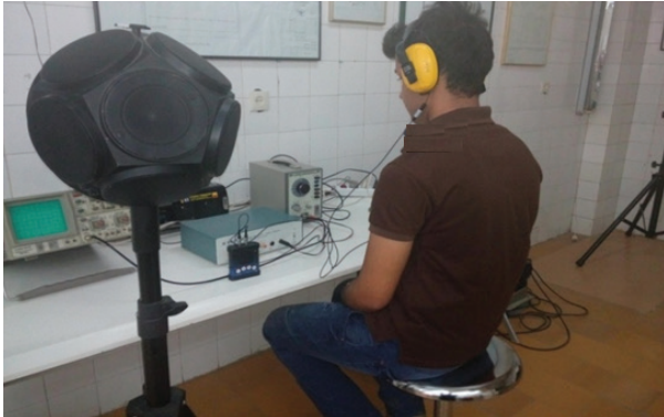
تصویر ۱: تعیین قدرت کاهندگی صدای گوشی بر روی افراد مطابق با روش استاندارد ISO ۱۱۹۰۴

کاهندگی اسمی در محدوده ۶۴٪ الی ۹۲٪ قرار دارد. نسبت میانگین کاهندگی نمونه واقعی به میانگین کاهندگی روی مانکن سر در جدول ۳ نشان داده شده است. نتایج آزمون آماری نشان داد بین میانگین کاهندگی گوشی‌ها روی نمونه واقعی و مانکن سر اختلاف معنی داری وجود ندارد ( P > 0.05 ). نتایج مربوط به تعیین قدرت کاهندگی صدای سه گوشی