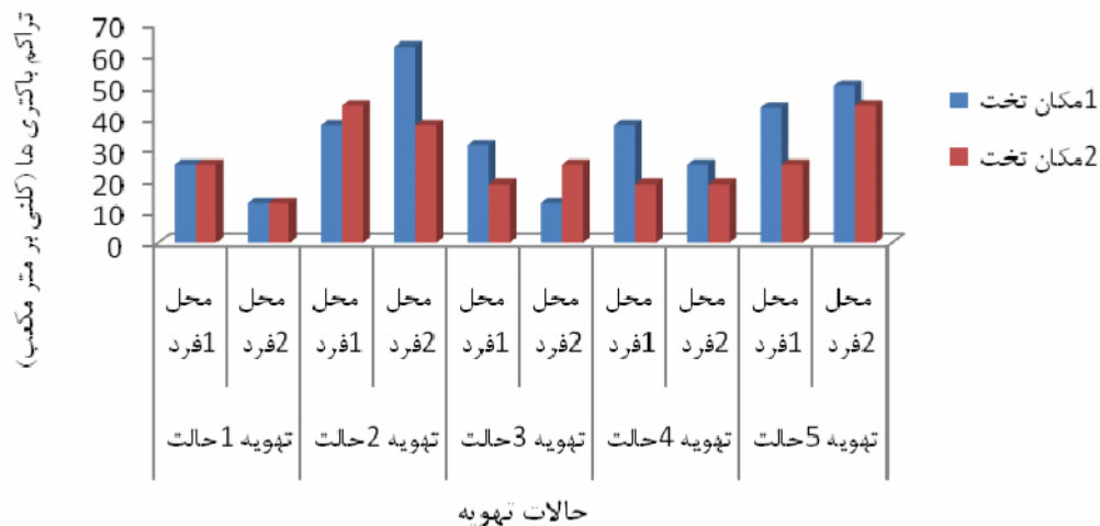
شکل ۲- تغییرات تراکم بیوآئروسول‌ها در ظرفیت تهویه‌ای ۱۲ بار تعویض هوا

نتایج مطالعه نشان داد که بیشترین مواجهه‌ی شغلی بابیوآئروسول‌ها در زمانی که سیستم تهویه خاموش بود مشاهده گردید و استفاده از حالات مختلف تهویه سبب کاهش معنی‌دار ( P_{\text{value}} < 0.001 ) مواجهه‌ی فردی بابیوآئروسول‌ها گردیده است. کمترین میزان مواجهه فردی مربوط به ۱۲ بار تعویض هوا در ساعت بود. اختلاف معنی‌داری از نظر کاهش تراکم آلاینده در منطقه‌ی تنفسی شاغلین میان ظرفیت تهویه ۶ بار و ۱۲ بار تعویض هوا در ساعت مشاهده نگردید ( P_{\text{value}} > 0.05 ). همچنین