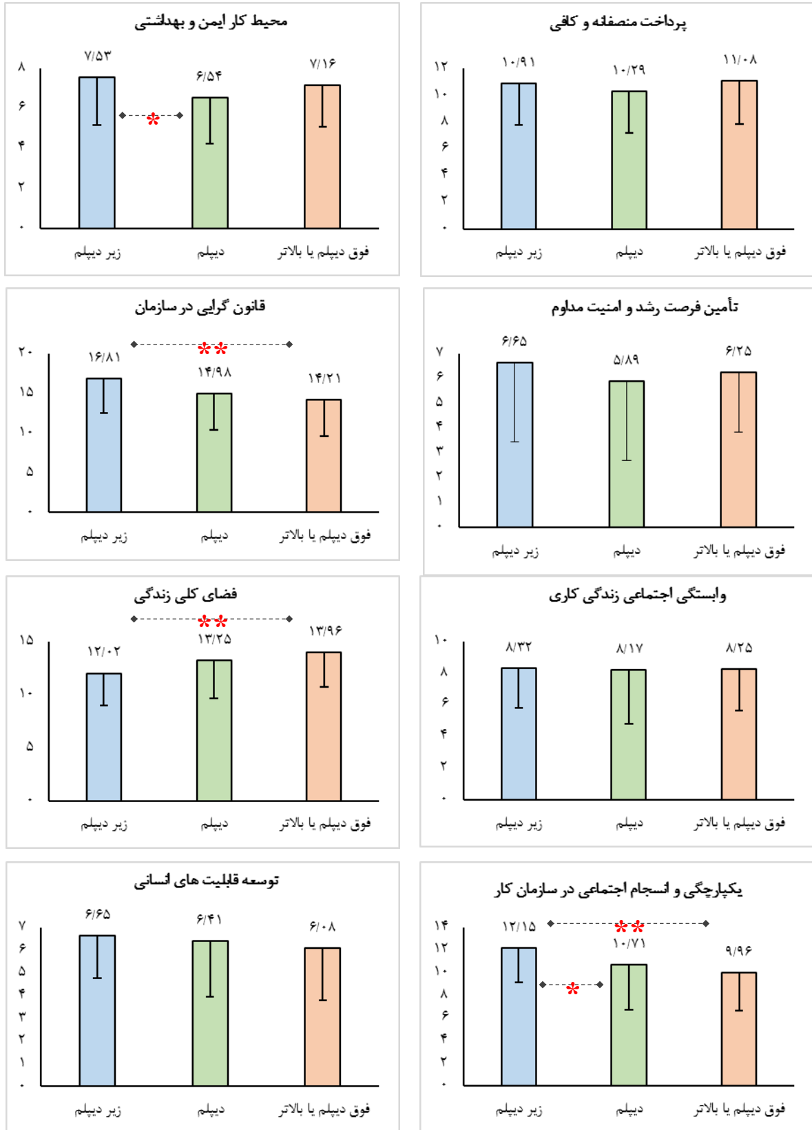
شکل ۲: میانگین ابعاد کیفیت زندگی کاری در رانندگان به تفکیک سطح تحصیلات، علامت* به معنی معنادار بودن تفاوت در سطح ۰/۰۵ و علامت** به معنی معنادار بودن تفاوت در سطح ۰/۰۱ است.

شاخص توده‌ی بدنی بین ۱۸/۵ تا ۲۴/۹، بین ۲۵ تا ۲۹/۹ و ۳۰ یا بیشتر قرار گرفتند. به منظور مقایسه‌ی وضعیت کیفیت زندگی کاری