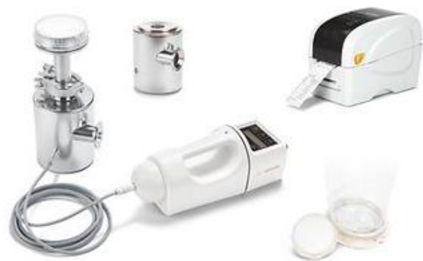
شکل ۴: نمونه‌بردار MD-8

همچنین از نمونه‌برداری با نمونه‌بردار MD-8 (شکل ۴) برای نمونه‌برداری از دو کروناویروس سندرم حاد تنفسی خاورمیانه و سندرم تنفسی حاد از هوای داخل بیمارستان استفاده شده است. در این مطالعات نمونه‌برداری با فیلتر گلاتین