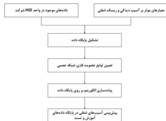
نمودار ۱: روش تجزیه و تحلیل داده‌ها

با توجه به نوع داده‌های این پژوهش و بررسی الگوریتم‌های ANFIS مشخص می‌شود که استفاده از ANFIS در تحلیل ریسک به چند دلیل کاملاً مناسب است. نخست آنکه الگوریتم ANFIS روشی مبتنی بر هوش مصنوعی است؛ از این رو می‌توان از داده‌های پیشین در جهت یادگیری استفاده کرد و به پیش‌بینی ریسک‌های جدید اقدام نمود. همچنین در این روش می‌توان دقت الگوریتم‌ها را تعیین کرد و خطاهای پیش‌آمده را آنالیز نمود. باید خاطر نشان ساخت سایر روش‌هایی که مبتنی بر هوش مصنوعی نباشند، نمی‌توانند این قابلیت‌ها را داشته باشند که این مهم نکته قوت دیگری برای به‌کارگیری الگوریتم ANFIS در اجرای پژوهش است. یک مدل فازی سوگنو درجه یک با دو ورودی x و y و یک خروجی z را در نظر بگیرید. قواعد فازی نوعاً می‌توانند به صورت زیر باشند [۱۰]: