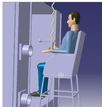
شکل ۲: شبه‌سازی ایستگاه کاری پیشنهادی در محیط کتیا

جزئیات ایستگاه کار را قبل از ساخت ارزیابی کرد [۳۸]. تغییر زاویه در مفاصل مدل شبه‌سازی شده در محیط نرم‌افزار نشان داد با حفظ عملکرد و حدود دسترسی می‌توان سطح ریسک را تا حد زیادی کاهش داد [۳۹]. همچنین در خصوص اصلاح ایستگاه کاری تحقیقات مشابهی انجام شده است [۴۰-۴۲]. Swinton و همکاران در مطالعه‌ای که به منظور ارزیابی اثربخشی مداخله ارگونومی در طراحی صندلی انجام دادند، به این نتیجه رسیدند که سطح خطر پس از مداخله به صورت معنی‌داری کاهش یافته است [۴۳]. در مطالعه Gonen و همکاران نیز مونتازژ در نرم‌افزار کتیا طراحی شد و بعد از ساخت آن به جای دو مونتازژ کار، به یک نفر نیاز بود. در نتیجه زمان تولید ۶۰ درصد کاهش یافت و کارگر دوم می‌توانست در میز دیگری کار کند [۲۰].