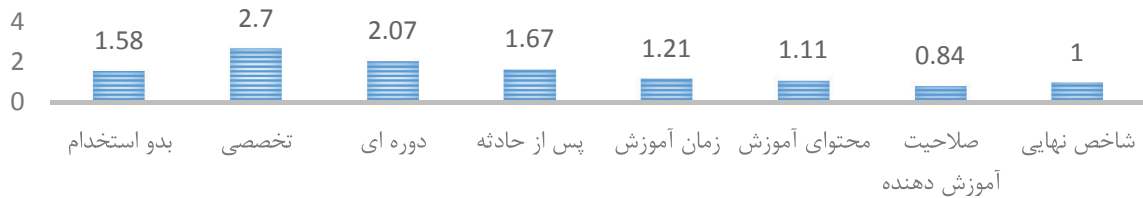
تصویر ۲: تأثیر پذیری فاکتور آموزش