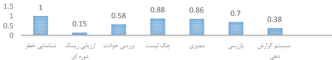
تصویر ۳: تأثیر پذیری فاکتور ارزیابی ریسک