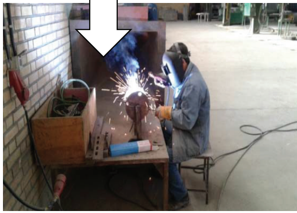
تصویر ۳: جوشکاری قبل و بعد از مداخله