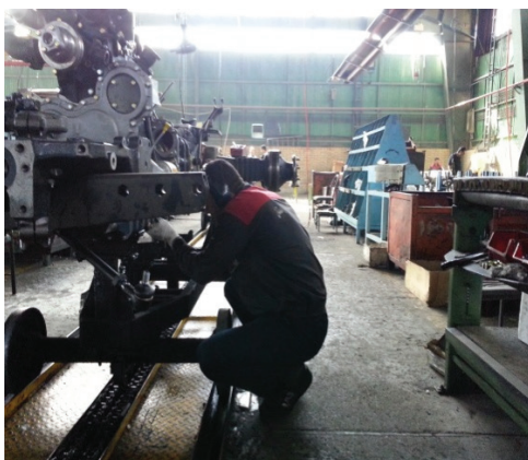
تصویر ۲: تصویر اپراتور خط مونتاژ قبل و بعد از مداخله

نتایج حاصل از پرسشنامه نوردیک قبل و بعد از مداخله در تصویر ۱ آمده است. همان طور که مشخص است اختلالات اسکلتی عضلانی در اندام‌های شانه، بازو، قوزک و پنجه در افراد مورد مطالعه به صفر رسیده است. همچنین در اندام‌های گردن، کمر، مچ و انگشتان، پا و زانو تعداد موارد اختلالات اسکلتی به ترتیب از ۶، ۴، ۵، ۷ به ۳، ۳ و ۳ کاهش یافته است. در مجموع از ۳۰ مورد اختلالات شناسایی شده قبل از مداخله با مداخله صورت گرفته این تعداد به ۱۱ مورد رسیده است (تصویر ۲).