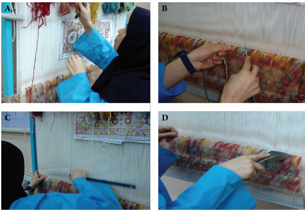
تصویر ۱: زیر وظایف شغلی قالی‌بافی

و پوسچری ایستا دارند. در چنین شرایطی عضلات بالابرنده نقش بسیار چشم‌گیری بر حفظ پوسچر شانه دارند. میانگین زوایای پوسچری افراد حین قالی‌بافی در جدول ۲ خلاصه شده است.