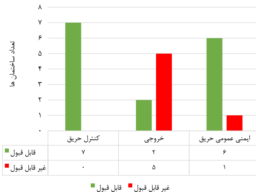
شکل ۲: وضعیت ایمنی حریق ساختمان‌ها در هر سه جنبه بررسی شده

در زمینه کنترل حریق، ساختمان ۶ و ۴ با کسب ۵/۵ امتیاز بهترین وضعیت و بیشترین سطح انطباق را در میان ساختمان‌های منتخب داشتند. در زمینه خروجی، ساختمان ۷ با کسب ۲/۵ امتیاز بهترین وضعیت و بیشترین سطح انطباق را داشت. همچنین در زمینه ایمنی عمومی حریق، ساختمان ۷ با کسب ۵ امتیاز بهترین وضعیت و بیشترین سطح انطباق را داشت. بررسی وضعیت ایمنی حریق ساختمان‌ها در هر سه جنبه (شکل ۲) نشان می‌دهد که مطلوب‌ترین وضعیت در زمینه کنترل