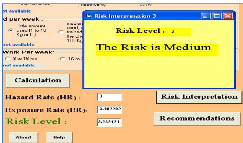
شکل ۶- تفسیر سطح ریسک محاسبه شده توسط نرم افزار SQCRA