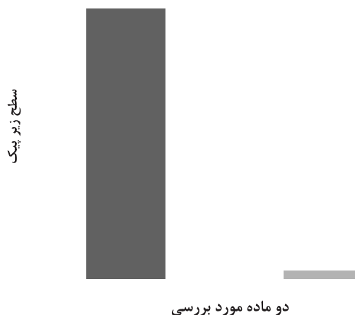
تصویر ۲: سطح زیر پیک دو ماده در دما و زمان بهینه استخراج