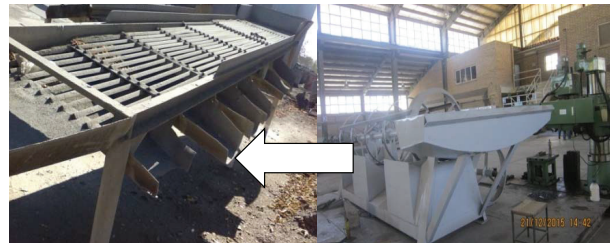
تصویر ۵: گلوله سورت‌کن قبل و بعد از مداخله

قبل و بعد از مداخله را نشان می دهد. در شروع مداخله بیشترین شیوع ناراحتی‌ها در اندام‌های کمر، زانو، گزارش گردید که تمامی افراد آن را ناشی از فشار کار، حمل دستی بار و تردد از پله می‌دانستند. بعد از مداخله شیوع اختلال در نواحی زانو، کمر، شانه، آرنج، مچ دست، پشت و ناحیه باسن ران کاهش معنی‌داری را با توجه به نتایج آزمون مک نمار نشان داد. ضمن این کاهش در نواحی گردن و قوزک پا معنی‌دار نبود.