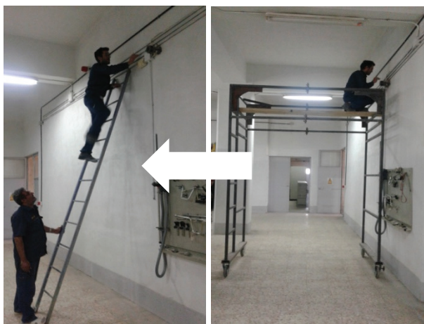
تصویر ۴: جایگاه کار قبل و بعد از مداخله

تصویر ۲: مواجهه با ریسک فاکتور استرس با توجه به ارزیابی سریع مواجهه قبل و بعد از مداخله