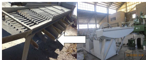
تصویر ۵: گلوله سورت‌کن قبل و بعد از مداخله

قبل و بعد از مداخله را نشان می دهد. در شروع مداخله بیشترین شیوع ناراحتی‌ها در اندام‌های کمر، زانو، گزارش گردید که تمامی افراد آن را ناشی از فشار کار، حمل دستی بار و تردد از پله می‌دانستند. بعد از مداخله شیوع اختلال در نواحی زانو، کمر، شانه، آرنج، مچ دست، پشت و ناحیه باسن ران کاهش معنی‌داری را با توجه به نتایج آزمون مک نمار نشان داد. ضمن این کاهش در نواحی گردن و قوزک پا معنی‌دار نبود.