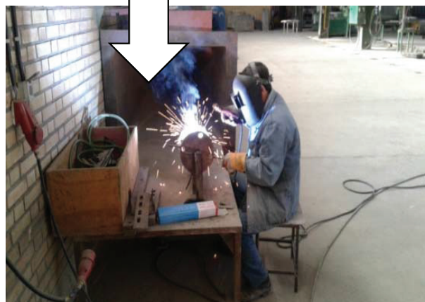
تصویر ۳: جوشکاری قبل و بعد از مداخله