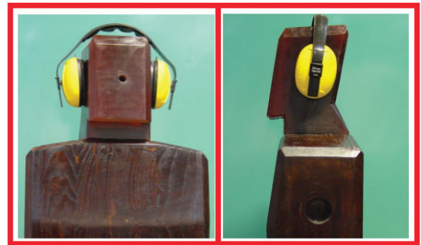
تصویر ۲: نمای آداپتور ساخته‌شده و چگونگی قرار گرفتن حفاظ رو گوشی روی سر

در جدول ۳ نتایج میانگین کاهندگی عملیاتی گوشی‌ها در محیط کار و با شرایط واقعی ارائه گردیده است. نتایج به دست آمده از این روش نشان می‌دهد که کمترین کاهندگی مربوط به حفاظ رو گوشی Bilsonم زرد و بیش‌ترین کاهندگی مربوط به گوشی حفاظ رو گوشی Brookland می‌باشد.