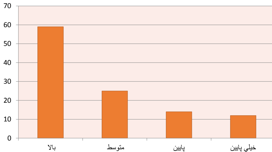
نمودار ۲- نتایج نهایی سطح ریسک‌های پیش‌بینی شده بر اساس روش SHERPA

طبق نمودار ۲، ۵۹٪ از خطای انسانی شناسایی شده با احتمال رخداد "بالا"، ۲۵ درصد احتمال رخداد "متوسط"، ۱۴